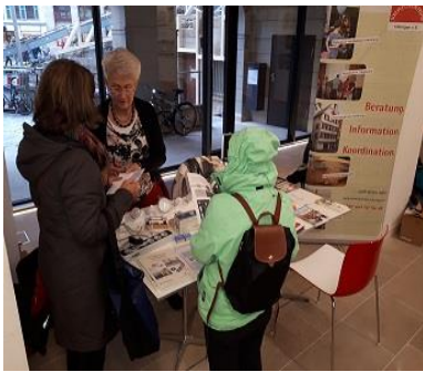
Abb. 1 Beratungsnachmittag im Rathaus-Foyer

Seit 2016 lief das Projekt Energielabor Tübingen. Über einen Projektzeitraum von drei Jahren wurde unter dem Titel „Gemeinsam zur Energiewende“ untersucht, wie eine nachhaltige Energiewende in der Stadt möglich ist. Fünf Quartiere in Tübingen wurden dafür genauer unter die Lupe genommen.