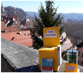
Annahme u.a. von Handys und CDs im UWZ

Über 400 Gespräche führten wir im vergangenen Jahr mit interessierten und ratsuchenden Bürger*innen, die Fragen u.a. zu Biodiversität (hauptsächlich Wildbienen), Klimawandel und Klimaschutz, Recycling und Energie, nachhaltigen Dämmstoffen, naturschutzfachlichen Themen (Wespen etc.) sowie einer nachhaltigeren Lebensweise hatten. Außerdem wurden Fragen zum Umweltzentrum selbst, Möglichkeiten zur Mitarbeit und zur „Nacht der Nachhaltigkeit“ gestellt. Darüber hinaus ist das UWZ Anlaufpunkt aufgrund seines Recyclingangebots; die kostenlose Abgabe von Aluminium, CDs, Handys und Kork wird sehr gut angenommen. Grundsätzlich freut uns das, da weniger Rohstoffe weggewor-