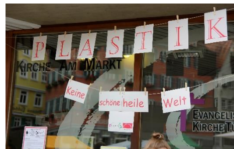
Ausstellung bei der NdN 2019